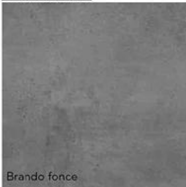
Paviment: 60x60 model Brando Fonce..