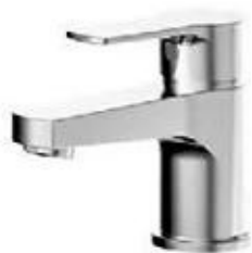
Aixeta concept 50 en lavabos