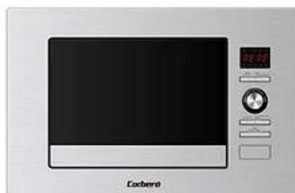
MICROONES CMICP100 o similar