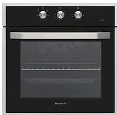
FORN ELÈCTRIC CORBERÓ CCH509X o similar

Cuina equipada amb mobles modulars alts i baixos de la casa SANTOS, amb tiradors d'acer inoxidable o similar, calaixera amb guies rodades i sistema de frenat. Taulell de cuina de granit nacional. Els electrodomèstics seran de la casa Corberó. S'instalarà forn, microones, placa d'inducció, frigorífic i campana extractora. Aigüera d'acer inoxidable, instal·lat sobre taulell. Aixeta de l'aigüera monocomandament.