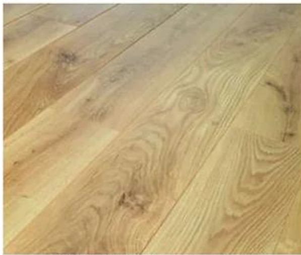
PARQUET HELVETIC ROBLE MALAGA

Els paviments estan realitzats amb parquet sintètic antihumitat AC5 en tot l'habitatge excepte en les zones humides. El sòcol es antihumitat lacat de color blanc del mateix color de la fusteria interior.