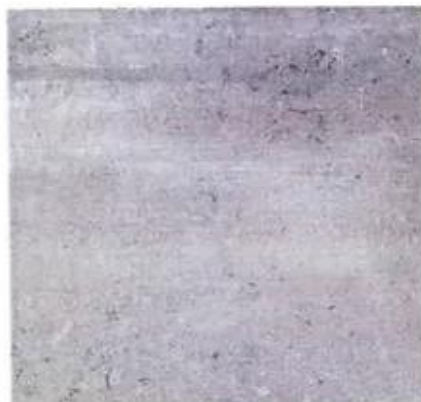
PAVIMENT CUINES. ATELIER BETON 60X60.

Paviments de gres en cuines, banys i safareigs, i enrajolats en les mateixes dependències. En terrasses i balcons hi ha instal·lat gres ceràmic antilliscant. En cuines el col·locarà gres model Atelier Beton de 60x60.