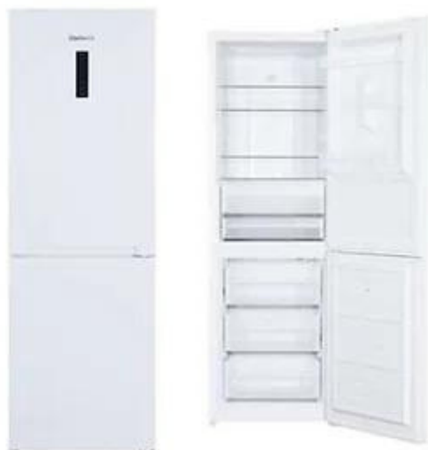
COMBI 185x60 NO FROST CCH18521EWD o similar