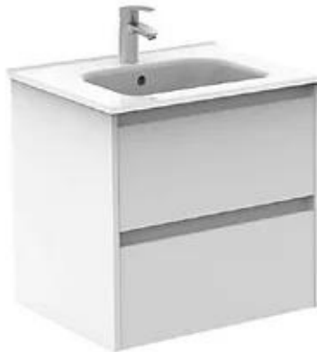
Moble amb rentamans integrat.

Bany amb banyera o dutxa segons distribució de cada habitatge. Banyera de xapa d'acer esmaltat i dutxes planes de resina.