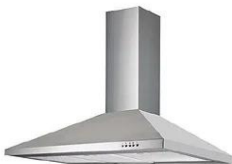
CAMPANA 90 CM FRECAM o similar