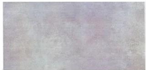
Enrajolat: 120x60 model Concept light grey.