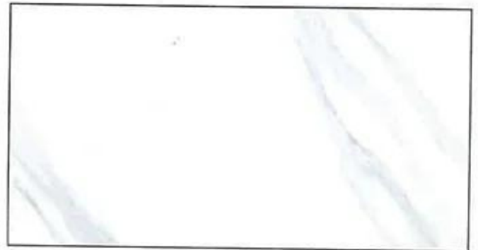
Enrajolat: 120x60 model Heaven.