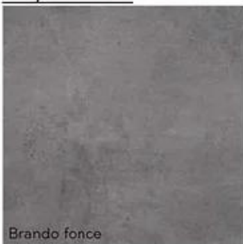
Paviment: 60x60 model Brando Fonce.